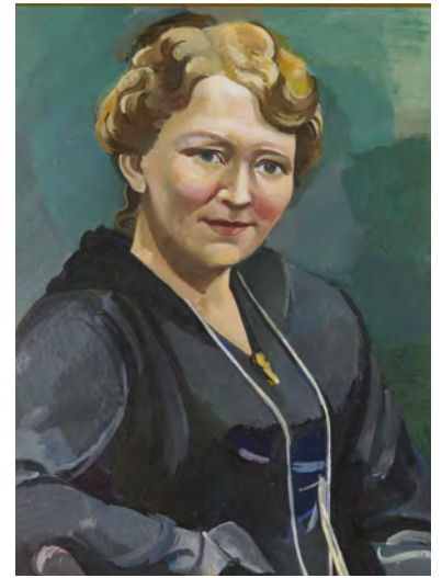
Fyrsta konan sem tók sæti á Alþingi var Ingibjörg H. Bjarnason (1867–1941). Hún sat á þingi árin 1922–1930.

Með sambandslögunum, sem tóku gildi 1. desember 1918, var Ísland viðurkennt fullvalda ríki í konungssambandi við Danmörku. Konungur varð að undirrita lög frá Alþingi til að þau tækju gildi en hafði neitunarvald samkvæmt stjórnarskránni. Konungur virti þingræðið og beitti því aldrei neitunarvaldi. Alþingi hafði löggjafarvald í öllum málum landsins en danska stjórnin fór áfram með utanríkismál. Starfshættir Alþingis breyttust hægt á næstu áratugum en sem dæmi um breytingar má nefna að frá árinu 1934 voru fjárlög afgreidd frá sameinuðu Alþingi í stað deilda.