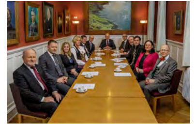
Forsætisnefnd Alþingis fundar vikulega um skipulag þingstarfa á þingtímanum.

Oft heyrast athugasemdir um að þunnskipað sé á bekkjum Alþingis við umræður. Ástæðurnar geta verið ýmsar. Þingmenn hvers flokks skipta nokkuð með sér verkum og sérhæfa sig í vissum málaflokkum. Útsending frá þingfundum gerir mönnum kleift að