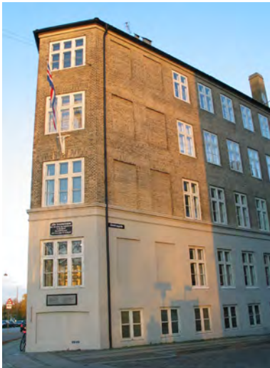
Jónshús við Øster-Voldgade 12 í Kaupmannahöfn.

Sýning um Jón Sigurðsson er opin þriðjudaga, miðvikudaga, fimmtudaga og föstudaga kl. 11–17, laugardaga og sunnudaga kl. 10–16 og á öðrum tímum í samráði við forstöðumann Jónshúss.