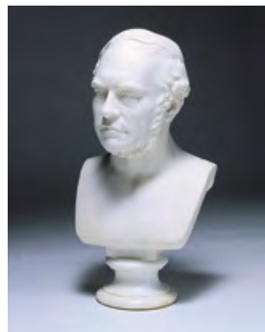
Jón Sigurðsson (1811–1879) var leiðtogi Íslendinga á fyrsta skeiði sjálfstæðisbaráttunnar. Starf hans bar ávöxt í fyrstu stjórnarskránni 1874. Honum til heiðurs var fæðingardagur hans, 17. júní, valinn sem stofndagur lýðveldisins 1944 og síðan þjóðhátíðardagur Íslendinga.

Kröfur almennings til áhrifa á stjórn ríkisins fóru vaxandi alla 19. öldina samhliða því sem þjóðerniskennend eflaðist. Viðbrögð danska einvaldskonungsins, eins og margra