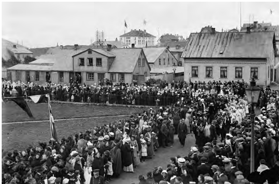
Konur fagna kosningarrétti þingsetningardaginn 7. júlí 1915 en kona náði ekki kjöri til þings fyrr en 1922. Í alþingiskosningunum 2017 náðu 24 konur kjöri og varð hlutfall þeirra þá 38%.