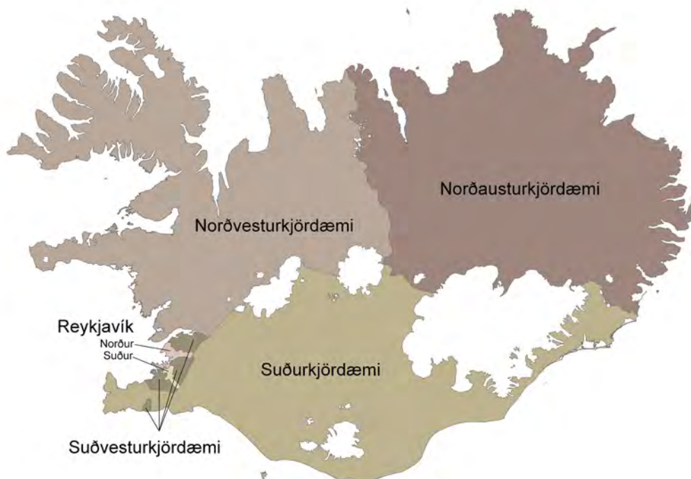
Ísland skiptist í sex kjördæmi, þrjú á höfuðborgarsvæðinu og þrjú landsbyggðakjördæmi. Fjöldi þingsæta í hverju kjördæmi tekur mið af íbúafjölda.

Í alþingiskosningum leita stjórnmalaflokkarnir umboðs þjóðarinnar til að taka ábyrgð bæði á löggjafarvaldi og framkvæmdarvaldi. Rík hefð er fyrir myndun meirihlutastjórna en stjórnarandstaðan á þingi veitir stjórninni aðhald. Alþingiskosningar fara að jafnaði fram fjórða hvert ár. Forseti Íslands getur þó rofið þing áður en venjulegu kjörtímabili lýkur og efnt til nýrra kosninga. Kosningarrétt við alþingiskosningar eiga allir íslenskir ríkisborgarar sem eru 18 ára eða eldri þegar kosning fer fram og eiga eða hafa átt lögheimili hér á landi. Kjörgengur við kosningar til Alþingis er hver sá sem á kosningarrétt og hefur óflekkað mannorð. Framboð til Alþingis er háð ýmsum skilyrðum, svo sem að nægilegur fjöldi manna hafi gefið skriflega yfirlýsingu um stuðning við framboðslistann. Að kosningum loknum taka 63 kjörnir þingmenn sæti á Alþingi.