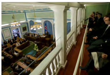
Þingpallar eru öllum opnir meðan þingfundir standa og þaðan er hægt að fylgjast með þingstörfum.

Í stjórnarskrá lýðveldisins Íslands er á því byggt að uppspretta valds sé hjá fólkinu sem felur kjörnum fulltrúum meðferð þess valds. Slíkt fyrirkomulag kallast fulltrúalýðræði. Kjósendur velja fjórða hvert ár í almennum leynilegum kosningum 63 þingmenn til setu á Alþingi. Þeir fara sameiginlega með vald til að setja þegnum landsins lög auk þess sem þeir fara með fjárstjórnarvald, þ.e. vald til að ákveða útgjöld ríkisins og þá skatta sem lagðir eru á landsmenn. Mikilvægt er að fólk viti hvaða ákvarðanir eru teknar á Alþingi og hvernig þær eru teknar því að kjósendur og fulltrúar þeirra bera ábyrgð á að varðveita virkt lýðræði. Segja má að kosningarrétturinn sé undirstaða lýðræðis á Íslandi og að Alþingi sé hornsteinn þess lýðræðis.