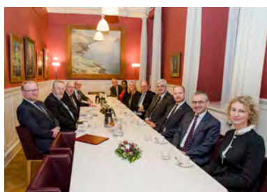
Frá fundi forsætisnefndar með Urban Ahlin, forseta sænska þingsins, og þingmönnum úr Riksdagen í Alþingi í febrúar 2018.

Fastanefndir þingsins taka enn fremur þátt í alþjóðastarfi. T.d. hefur utanríkismálanefnd regluleg samskipti við Evrópuþingið. Í júlí 2009 var skipaður starfshópur utanríkismálanefndar um Evrópumál. Einnig er starfandi, síðan í október 2010 sameiginleg þingmannanefnd Íslands og Evrópusambandsins.