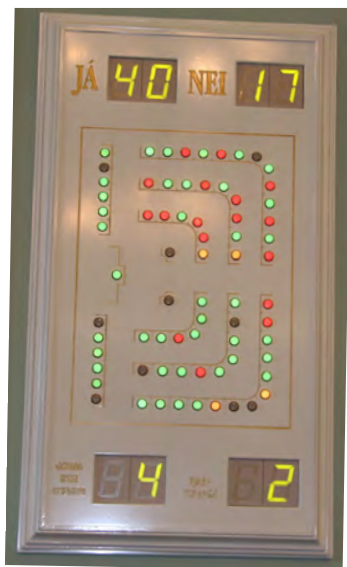
Þingmenn greiða atkvæði með því að ýta á einn af þremur hnöppum sem eru í borðum þeirra. Niðurstöðurnar, og hvernig hver og einn greiðir atkvæði, birtast á ljósatöflum í þingsalnum.

Þegar vandi stæðar að í íslensku þjóðfélagi er oft sagt að nú verði Alþingi að grípa í taumana. Þetta sést á bloggsíðum, í lesendabréfum og greinum dagblaðanna, heyrst í útvarps- og sjónvarpsviðtölum og yfir kaffibolla heima í eldhúskrók. Þegar til kastanna kemur eru það stjórnálamenn sem ákveða hvort rétt sé að taka á viðfangsefninu með lagasetningu. Hugmyndir um lagasetningu geta komið víða að. Hagsmunaaðilar reyna að hafa áhrif á undirbúning lagasetningar, oft í gegnum fjölmiðla. Einstaklingar geta einnig látið skoðun sína í ljós, t.d. með greinaskrifum og með því að hafa samband við