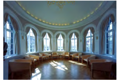
Kringlan var byggð við Alþingishúsið 1908.

Alþingisgarðurinn mun vera fyrsti opinberi skrudgarðurinn á Íslandi. Tryggva Gunnarssyni (1835–1917), alþingismaður og bankastjóri, var falið að sjá um framkvæmdir í garðinum. Garðurinn er nánast óbreyttur frá upphaflegu skipulagi. Hafist var handa um framkvæmdir við garðinn árið 1893. Tryggvi lét skipta um jarðveg í garðstæðinu og fékk plöntur víða af landinu en flutti einnig til landsins m.a. víðitegund sem dregur íslenskt nafn sitt af garðinum og er kölluð þingvíðir. Tryggvi lagði mikla alúð við ræktun garðsins og að eigin ósk hvílir hann þar og er yfir gröfni brjóstmynd af honum eftir Ríkarð Jónsson (1888–1977).