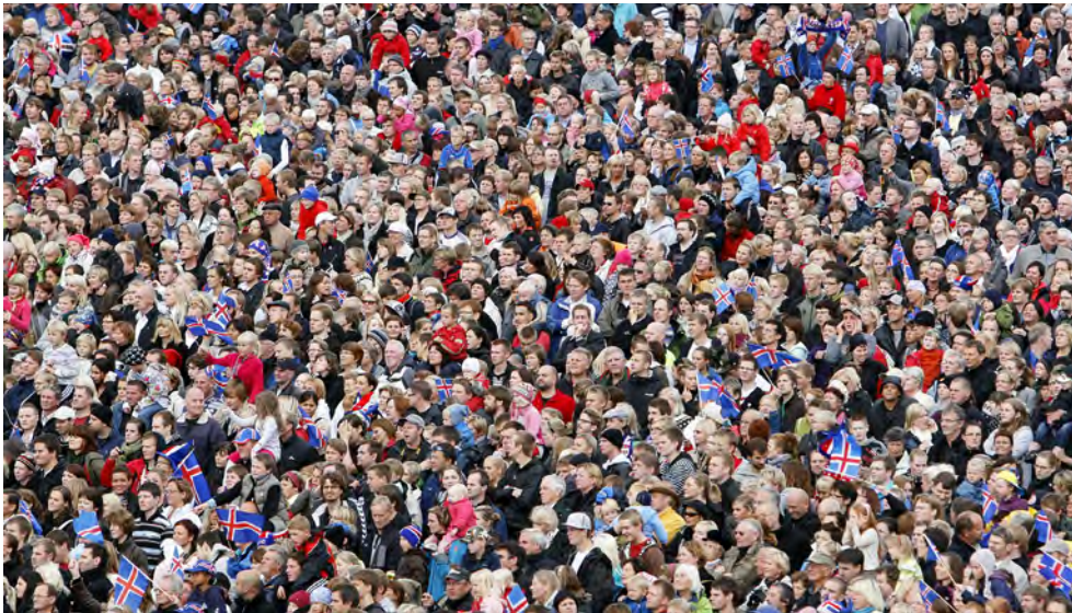
Í alþingiskosningunum í október 2017 neyttu 81,2% kosningarbærra manna kosningarréttar síns.

Breytingar á kjördæmamörkum og tilhögun á úthlutun þingsæta, sem fyrir er mælt í lögum, verða aðeins gerðar með samþykki 2/3 atkvæða á Alþingi. Kosid var eftir þessari kjördæmaskipan í fyrsta sinn í alþingiskosningunum 2003 en landinu var áður skipt í átta kjördæmi og hafði sú skipan verið á síðan 1959.