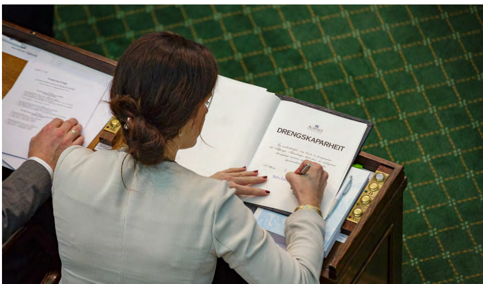
Þingmenn vinna drengskaparheit að stjórnarskránni þegar þeir taka sæti á Alþingi í fyrsta sinn.

Þú getur skrifað þingmönnum um mikilvæg málefni. Netföng eru á www.althingi.is . Heimilisfang: Alþingi, 101 Reykjavík. Þú getur hringt í þingmenn og komið sjónarmiðum þínum á framfæri. Sími: 563 0500.