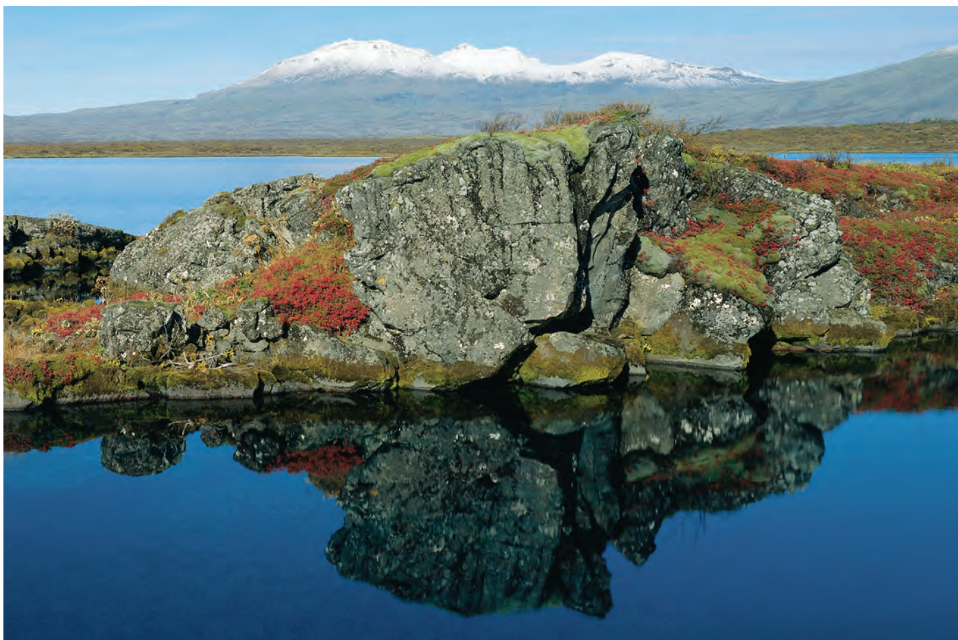
Á fáum stöðum á Íslandi fléttast saga og náttúra jafnmikið saman og á Þingvöllum. Þar gefst einstök yfirsýn yfir jarðfræðisögu, og lifandi náttúra Þingvallasveitar á sér vart hliðstæðu. Á Þingvöllum var allsherjarriki á Íslandi komið á fót með stofnun Alþingis 930 og þar kom þingið saman allt til ársins 1798.

Ákvæði stjórnarskrár um skoðanafrelsi, tjáningarfrelsi, félagafrelsi og fundafrelsi eru einnig skýr einkenni lýðræðisskipulagsins. Í reynd eru þessir þættir nauðsynleg forsenda lýðræðis svo að þegnum landsins sé tryggður réttur til þátttöku í málefnum þjóðfélagsins. Ákvarðanir sem teknar eru á Alþingi hafa áhrif á daglegt líf allra Íslendinga. Markmiðið með útgáfu kynningarbæklings um Alþingi er að greina frá skipulagi og störfum þingsins ásamt sögu þess. Hann ætti því að nýtast öllum þeim sem hafa áhuga á að fræðast um Alþingi.