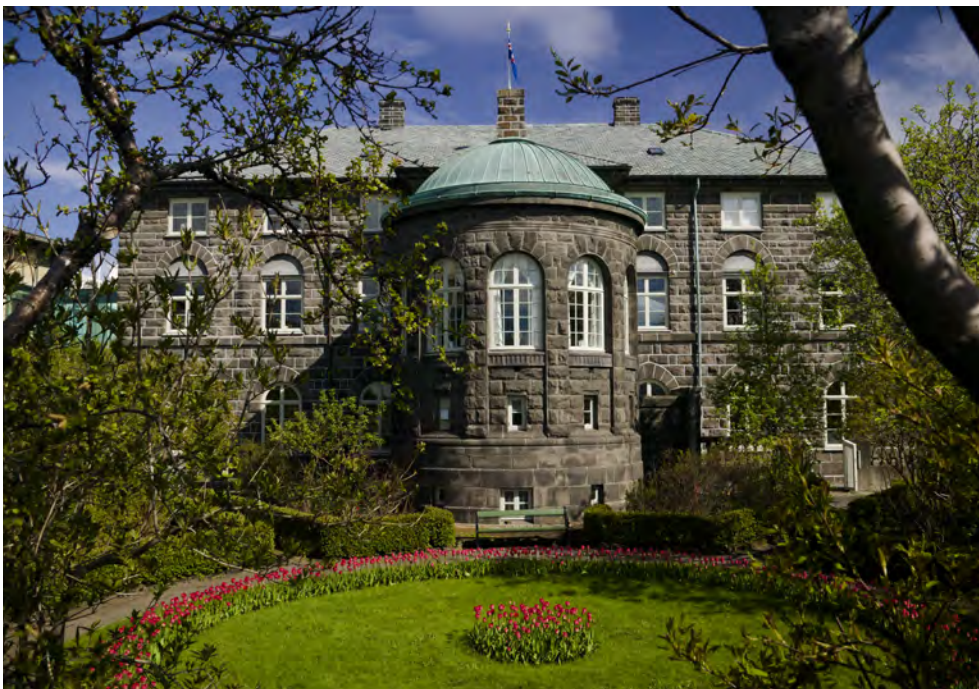
Alþingisgarðurinn og suðurhlíð þinghússins. Hafist var handa um framkvæmdir í garðinum árið 1893.