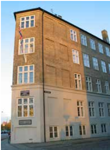
Jónshús við Øster-Voldgade 12 í Kaupmannahöfn.

Sýning um Jón Sigurðsson er opin þriðjudaga, miðvikudaga, fimmtudaga og föstudaga kl. 11–17, laugardaga og sunnudaga kl. 10–16 og á öðrum tímum í samráði við forstöðumann Jónshúss. Nánari upplýsingar á www.jonshus.dk .