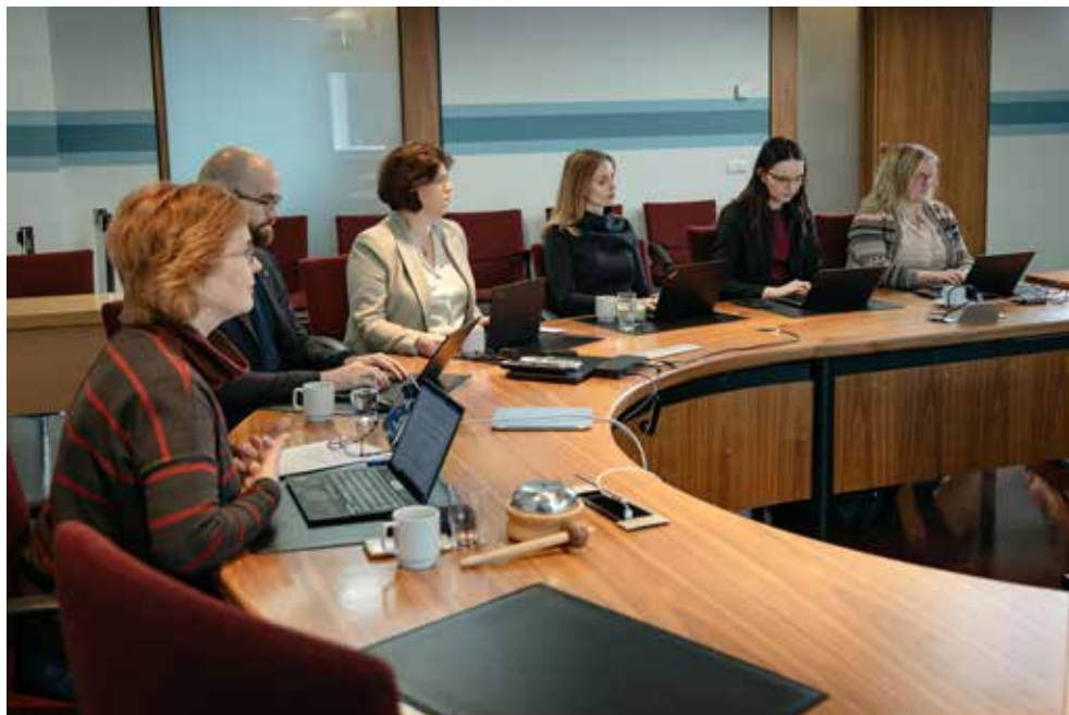
Nefndarmenn geta sameinast um að leggja fram frumvarp í nafni nefndarinnar um málefni sem eru á verkefsviði hennar. Fundur í stjórnskipunar- og eftirlitsnefnd.