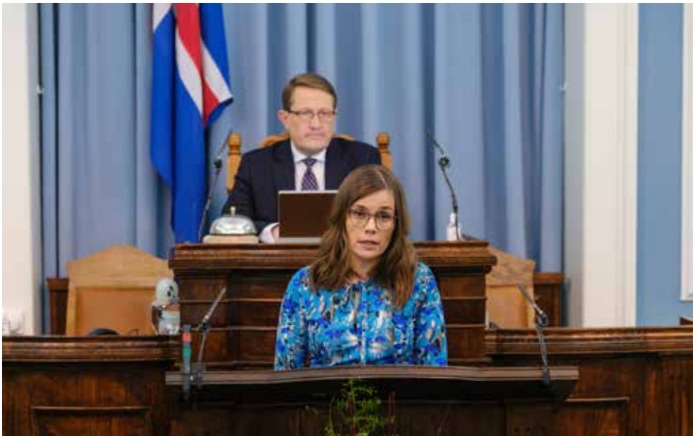
Katrín Jakobsdóttir forsætisráðberru og Birgir Ármannsson, forseti Alþingis.

Alþingistíðindi, öll þingskjöl og ræður ásamt öðru efni þingfunda, eru birt á vef Alþingis.