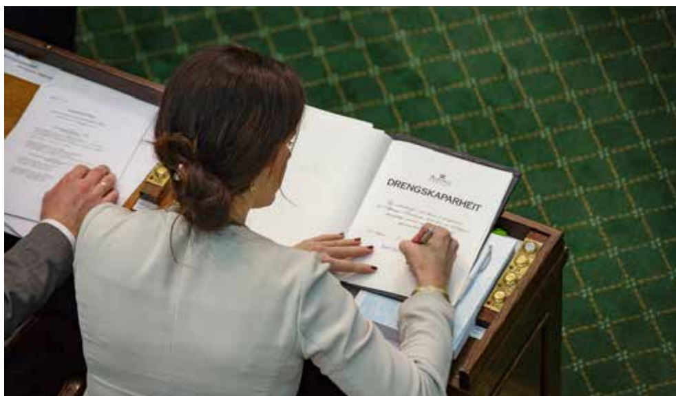
Þingmenn vinna drengskaparheit að stjórnarskránni þegar þeir taka sæti á Alþingi í fyrsta sinn.

Þú getur skrifað þingmönnum um mikilvæg málefni. Netföng eru á www.althingi.is . Þú getur hringt í þingmenn og komið sjónarmiðum þínum á framfæri. Sími 563 0500.