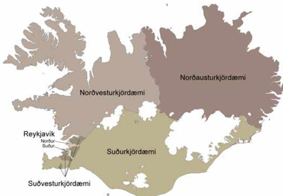
Ísland skiptist í sex kjördæmi, þrjú á höfuðborgarsvæðinu og þrjú landsbyggðakjördæmi. Fjöldi þingsata í hverju kjördæmi tekur mið af íbúafjölda.

Í alþingiskosningum leita stjórnmalaflokkarnir umboðs þjóðarinnar til að taka ábyrgð bæði á löggjafarvaldi og framkvæmdarvaldi. Rík hefð er fyrir myndun meirihlutastjórna en stjórnarandstaðan á þingi veitir stjórninni aðhald. Alþingiskosningar fara að jafnaði fram fjórða hvert ár. Forseti Íslands getur þó rofið þing áður en venjulegu kjörtímabili lýkur og efnt til nýrra kosninga. Kosningarrétt við alþingiskosningar eiga allir íslenskir ríkisborgarar sem eru 18 ára eða eldri þegar kosning fer fram og eiga eða hafa átt lögheimili hér á landi. Kjörgengur við kosningar til Alþingis er hver sá sem á kosningarrétt og hefur óflekkað mannorð. Framboð til Alþingis er háð ýmsum skilyrðum, svo sem að nægilegur fjöldi manna hafi gefið skriflega yfirlýsingu um stuðning við framboðslistann. Að kosningum loknum taka 63 kjörnir þingmenn sæti á Alþingi.