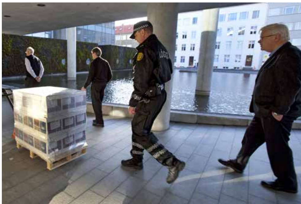
Lögreglan sér um að flytja kjörseðla úr prentsmíðju á kjörstaði.

Í alþingiskosningum leita stjórnmalaflokkarnir umboðs þjóðarinnar til að taka ábyrgð bæði á löggjafarvaldi og framkvæmdarvaldi. Rík hefð er fyrir myndun meirihlutastjórna en stjórnarandstaðan á þingi veitir stjórninni aðhald. Alþingiskosningar fara að jafnaði fram fjórða hvert ár. Forseti Íslands getur þó rofið þing áður en venjulegu kjörtímabili lýkur og efnt til nýrra kosninga. Kosningarrétt við alþingiskosningar eiga allir íslenskir ríkisborgarar sem eru 18 ára eða eldri þegar kosning fer fram og eiga eða hafa átt lögheimili hér á landi. Kjörgengur við kosningar til Alþingis er hver sá sem á kosningarrétt og hefur óflekkað mannorð. Framboð til Alþingis er háð ýmsum skilyrðum, svo sem að nægilegur fjöldi manna hafi gefið skriflega yfirlýsingu um stuðning við framboðslistann. Að kosningum loknum taka 63 kjörnir þingmenn sæti á Alþingi.