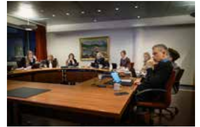
Fundur í efnabags- og viðskiptanefnd

Þingforseti stjórnar fundum Alþingis. Hann hefur rétt til að taka þátt í umræðum líkt og aðrir þingmenn og gegnir þá einhver varaforsetanna fundarstjórninni á meðan. Forseti Alþingis hefur atkvæðisrétt í þingsalnum. Þingforsetinn stýrir störfum Alþingis. Oft þarf hann að setta ólík sjónarmið og gæta hagsmuna margra. Þannig getur þingforseti ekki látið sjónarmið eigin flokks ráða gerðum sínum heldur verður hann að gæta þess að tekið sé á erindum allra þingmanna af sanngirni og réttssýni.