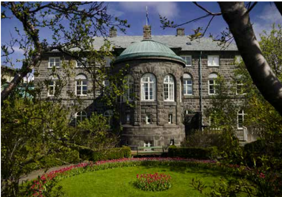
Alþingisgarðurinn og suðurblíð þinghússins. Hafist var handa um framkvæmdir í garðinum árið 1893.