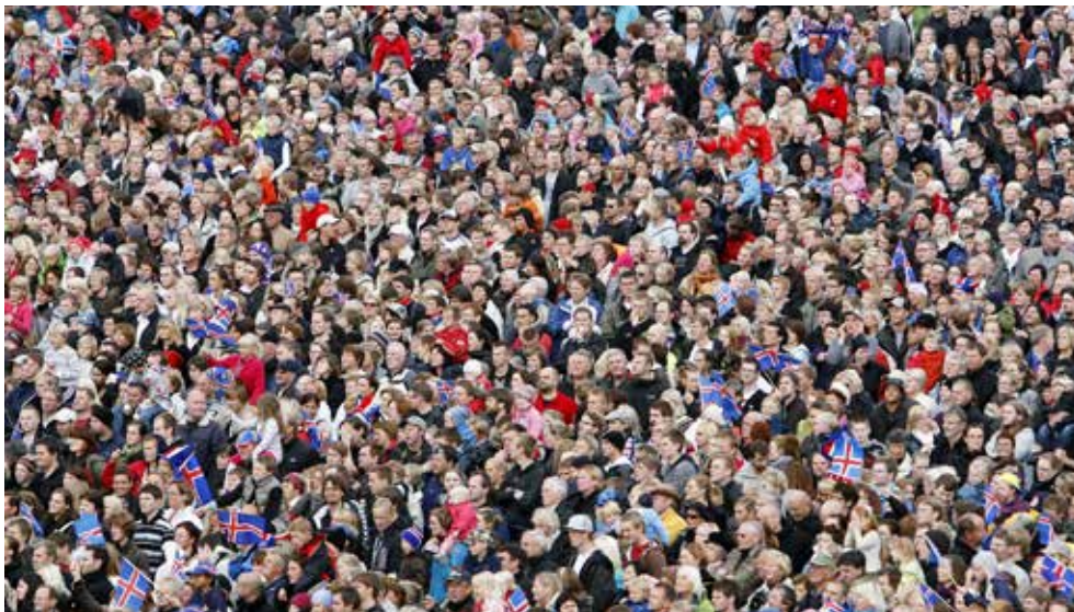
Alls greiddu 203.898 landsmenn atkvæði í alþingiskosningunum 2021 eða 80,1% þeirra sem voru á kjörskrá.

Breytingar á kjördæmamörkum og tilhögun á úthlutun þingsæta, sem fyrir er mælt í lögum, verða aðeins gerðar með samþykki 2/3 atkvæða á Alþingi. Kosid var eftir þessari kjördæmaskipan í fyrsta sinn í alþingiskosningunum 2003 en landinu var áður skipt í átta kjördæmi og hafði sú skipan verið á síðan 1959.