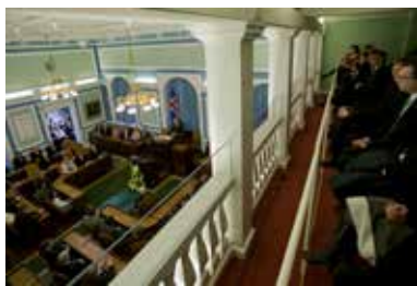
Þingpallar eru öllum opnir meðan þingsfundir standa og þaðan er hægt að fylgjast með þingsstörfum.

Í stjórnarskrá lýðveldisins Íslands er á því byggt að uppspretta valds sé hjá fólkinu sem felur kjörnum fulltrúum meðferð þess valds. Slíkt fyrirkomulag kallast fulltrúalyðræði. Kjósendur velja fjórða hvert ár í almennum leynilegum kosningum 63 þingmenn til setu á Alþingi. Þeir fara sameiginlega með vald til að setja þegnum landsins lög auk þess sem þeir fara með fjárstjórnarvald, þ.e. vald til að ákveða útgjöld ríkisins og þá skatta sem lagðir eru á landsmenn. Mikilvægt er að fólk viti hvaða ákvarðanir eru teknar á Alþingi og hvernig þær eru teknar því að kjósendur og fulltrúar þeirra bera ábyrgð á að varðveita virkt lýðræði. Segja má að kosningarrétturinn sé undirstaða lýðræðis á Íslandi og að Alþingi sé hornsteinn þess lýðræðis.