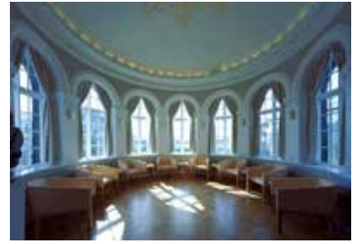
Kringlan var byggð við Alþingishúsið 1908.