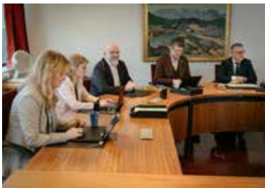
Fundur í utanríkismálanefnd.

Kosið er í alþjóðanefndir þingsins á fyrsta fundi Alþingis að afloknum alþingiskosningum. Kosnir eru þrír til sjö þingmenn og jafnmargir til vara. Starfsemi alþjóðanefnda Alþingis er mismunandi og fer eftir stöðu og starfsgrundvelli þeirra alþjóðlegra þingmannasamtaka sem Alþingi á aðild að. Sum alþjóðleg þingmannasamtök starfa samhliða ráðherraráði sem er vettvangur samstarfs ríkisstjórna. Þar sem svo er hafa þingmannasamtök formlega stöðu, skyldur og réttindi gagnvart ráðherraráði og beina til þess tillögum og ályktunum. Önnur þingmannasamtök eiga óformlegt samstarf við stjórnvöld eða alþjóðastofnanir. Alþjóðanefndir Alþingis sækja fundi og ráðstefnur hjá alþjóðlegum þingmannasamtökum sem fulltrúar Alþingis. Þær nýta tækifærið til að koma sjónarmiðum Íslands á framfæri þegar við á. Alþjóðleg þingmannasamtök vinna skýrslur og samþykkja ályktanir og tillögur sem beint er til stjórnvalda aðildarríkja og til alþjóðastofnana. Þingmannasamtök eru jafnframt vettvangur þingmanna til að skiptast á skoðunum og upplýsingum. Alþjóðanefndir Alþingis skipuleggja enn fremur fundi og ráðstefnur þingmannasamtaka hérlendis.