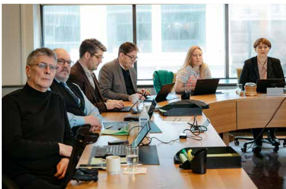
Kosið er í fastanefndir á fyrsta þingfundi að afloknum þingkosningum, níu þingmenn eru í nefnd. Fundur í velferðarnefnd.

Þú getur sent nefnd skriflega umsögn um þingmál að eigin frumkvæði og hefur slík umsögn sömu stöðu og þær sem berast samkvæmt beiðni nefndar. Leiðbeiningar um umsagnir um þingmál og aðrar upplýsingar eru á www.althingi.is . Þú getur þó vakið athygli nefnda á málefnum sem undir þær heyra með því að senda þeim erindi jafnvel þó það varði ekki mál sem er þegar til meðferðar í nefndinni.