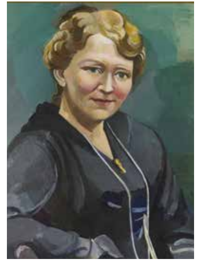
Fyrsta konan sem tók sæti á Alþingi var Ingibjörg H. Bjarnason (1867–1941). Hún sat á þingi árin 1922–1930.

Með sambandslögunum, sem tóku gildi 1. desember 1918, var Ísland viðurkennt fullvalda ríki í konungssambandi við Danmörku. Konungur varð að undirrita lög frá Alþingi til að þau tækju gildi en hafði neitunarvald samkvæmt stjórnarskránni. Konungur virti þingræðið og beitti því aldrei neitunarvaldi. Alþingi hafði löggjafarvald í öllum málum landsins en danska stjórnin fór áfram með utanríkismál. Starfshættir Alþingis breyttust hægt á næstu áratugum en sem dæmi um breytingar má nefna að frá árinu 1934 voru fjárlög afgreidd frá sameinuðu Alþingi í stað deilda.