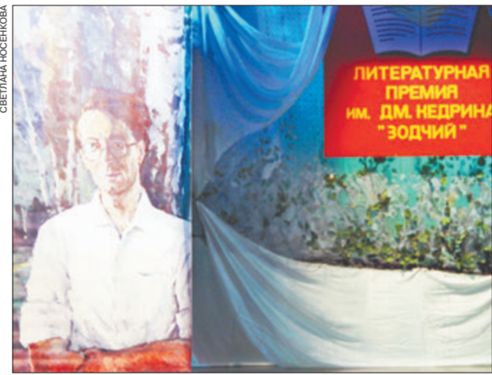
Память о Дмитрии Кедрине хранит «Зодчий»