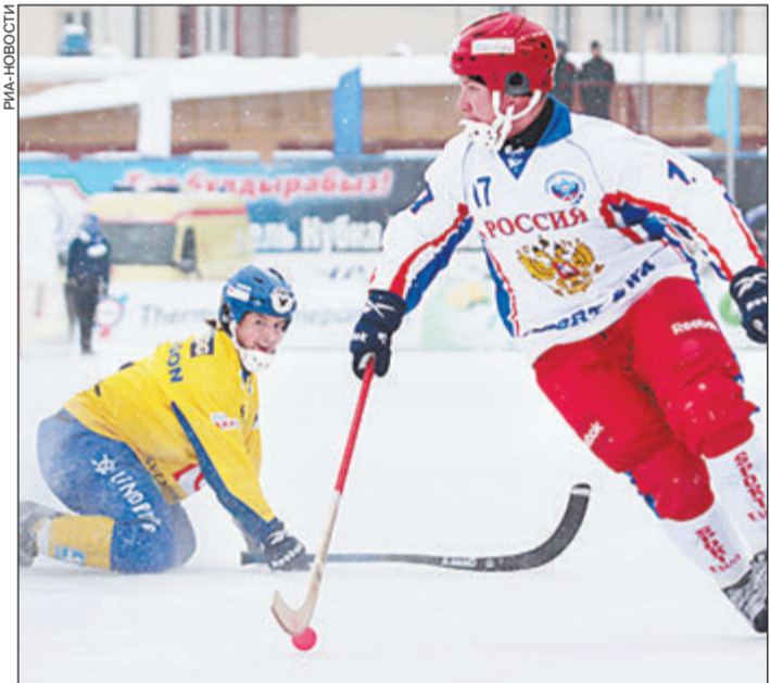
Российская сборная выиграла турнир в Абакане за явное преимущество