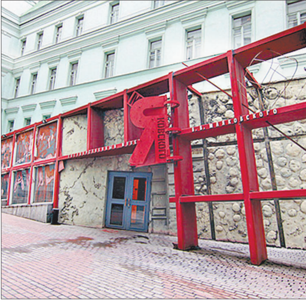
Подмосковные дети поучаствуют в праздновании юбилея Маяковского

Также планируется большая совместная выставка в здании Государственной Третьяковской галереи на Крымском Валу – «Владимир Маяковский и русский авангард», где будут представлены живопись, графика и фотографии, созданные Маяковским и художниками его ближайшего круга в середине 1910-х годов. На ней будет представлено творчество Д. Бурлюка, Н. Гончаровой, Е. Гуро, В. Каменского, Г. Клуциса, Э. Лисицкого, К. Малевича, О. Розановой,