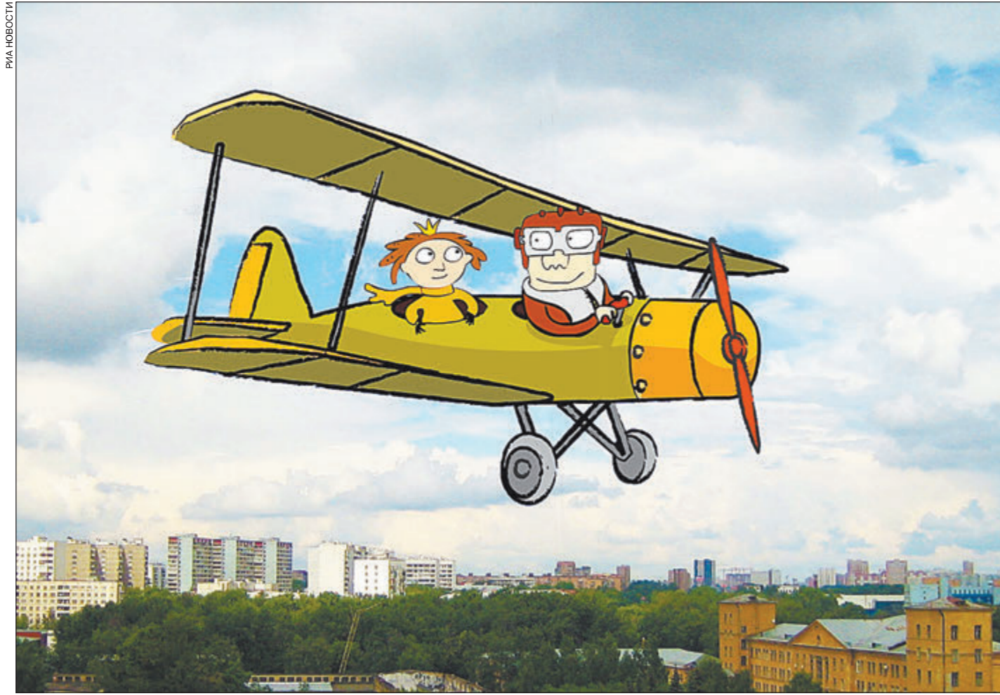
Маленький Принц и Авиатор из документального фильма «Скажи наркотикам - нет!»

Восемнадцать лет подряд «Мастер-Фильм» является организатором Открытого российского фестиваля анимационного кино, что проводится в Суздале. Здесь собирается весь цвет профессионалов-аниматоров. В 2013 году «Мастер-Фильм» проведет бесплатные показы в 50 городах страны, в том числе по всей Московской области. Проект «Реанимация» - это сорок девять мультфильмов и отдельный этап в жизни как самой компании, так и команды, что воплощала идею в жизнь. Девиз проекта, созданного для реанимации мозгов,