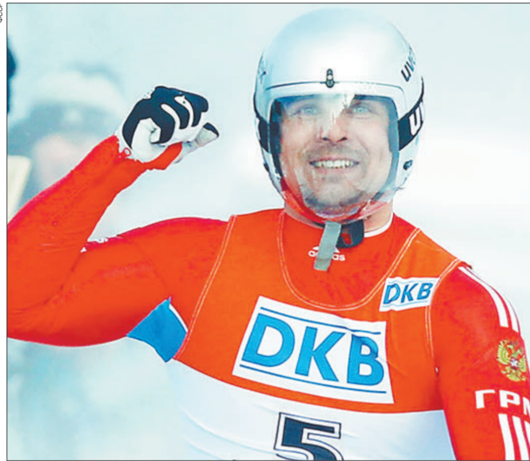
Альберт Демченко готовится к своей седьмой зимней Олимпиаде

А ведь знаменитого спортсмена из Демченко вполне могло и не получиться. В спортшколе в Чусовом его первый тренер отчислил Альберта за... бесперспективность из-за того, что тот был невысоким и слишком худым для саночника. Однако новый тренер пригласил всех, кто занимался в этой ДЮСШ раньше, для сдачи нормативов. Демченко выиграл тесты у всех, после чего вновь связал свою жизнь со спортом. Теперь уже навсегда. Тогда он не мог представить, что будет садиться