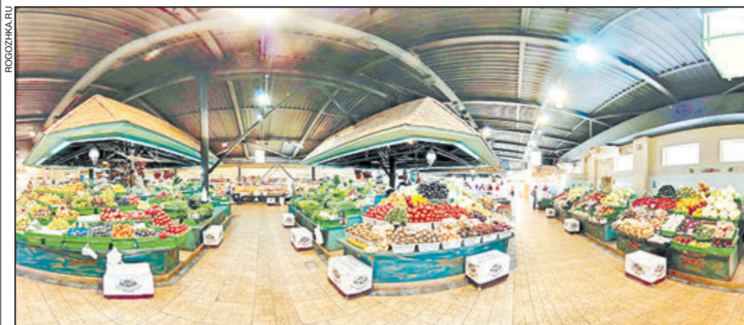
Кооперативные рынки пока не стали реальной альтернативой крупным торговым сетям

– Для профилактики в период подъема заболеваемости необходимо принимать аскорбиновую кислоту и поливитамины. Витамин С принимают внутрь по 0,5 – 1 г один-два раза в день. Ешьте больше квашеной капусты, а также цитрусовых – лимонов, мандаринов, киви, которые содержат большое количество витамина С. Полезен салат из свежей капусты с подсолнечным маслом. В качестве профилактики полезно 2 раза в день промывать передние отделы носа с мылом, полоскать горло растворами марганцовки, фурацилина, соды. Очень действенны ингаляции с эвкалиптом и содой в течение 2 – 3 мин., а также теплые ножные ванны с горчицей в течение 10 – 15 мин., после которых стопы растирают разогретой мазью. В свою очередь, главный государственный санитарный врач Геннадий Онищенко в связи с похолоданием в большинстве российских регионов порекомендовал теплее одеваться, воздержаться от длительного пребывания на открытом воздухе и тщательно следить за детьми, которые наиболее уязвимы для сезонных инфекций.