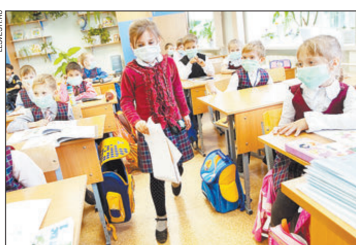
Дети наиболее подвержены сезонным ОРВИ

Ранее Онищенко заявлял, что эпидемия гриппа в декабре 2012 года маловероятна. Подъем заболеваемости может произойти уже в новом году, после январских каникул. По данным управления Роспотребнадзора по Московской области, за минувшую неделю с 7 по 14 декабря в регионе зарегистрировано 48 189 случаев заболеваний. Это на 2054 больше, чем неделей ранее. Грипп обнаружен у 5 человек. Среди заболевших две трети, а именно 32 206, дети в возрасте до 14 лет. Данные еженедельного мониторинга говорят о том, что впервые в эпидемию 2012 – 2013 годов отмечено пре-