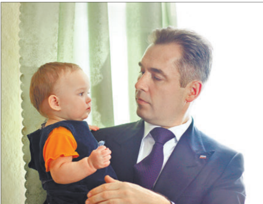
Павел Астахов активно лоббировав соглашение об усыновлении детей с США