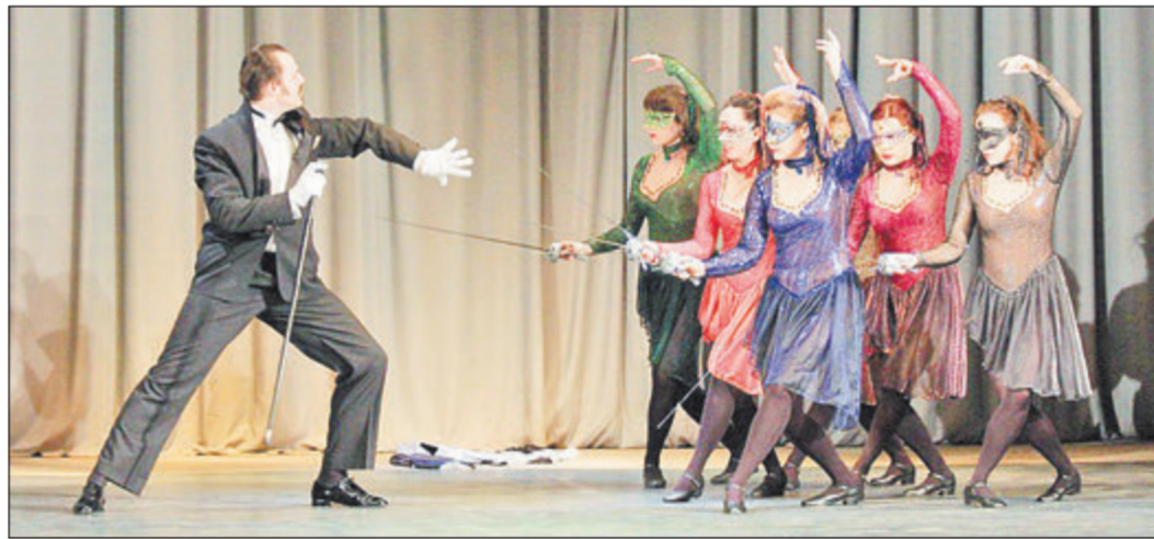
Соревнования по артистическому фехтованию не оставляют равнодушными никого

«Дуэль», не оставили никого в зале равнодушными. В фехтовании на «тяжелом» оружии по-прежнему вне конкуренции коломенские спортсмены - объединенная команда центра русской воинской культуры «Святогор» и муниципального бюджетного учреждения «Военно-исторический спортивно-культурный комплекс «Коломенский кремль». В дисциплине «Дует - античность», показав две композиции: «Михайло Потык» и «Судный бой», коломенцы заняли первое и второе места. В номинации «Группа - свободный стиль» им также не было равных, а третье место здесь с юмористической ком-