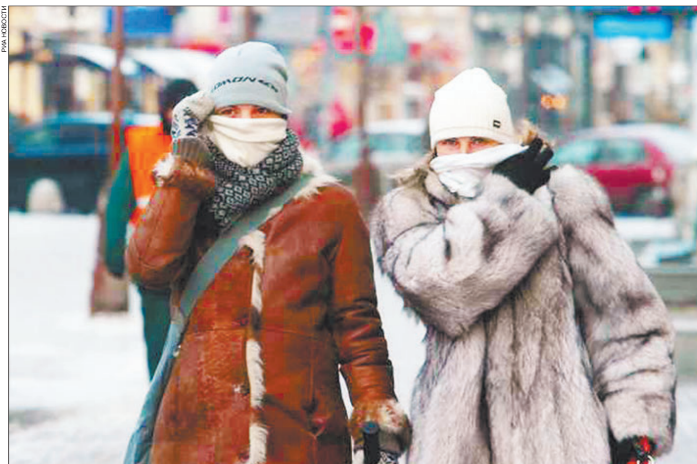
Встретить сильные холода лицом к лицу непросто

Как определить степень обморожения? В МЧС советуют, войдя в дом с мороза, постучать носком о пятку, проверить, не потеряли ли чувствительность пальцы ног. Если пальцев не чувствуем,