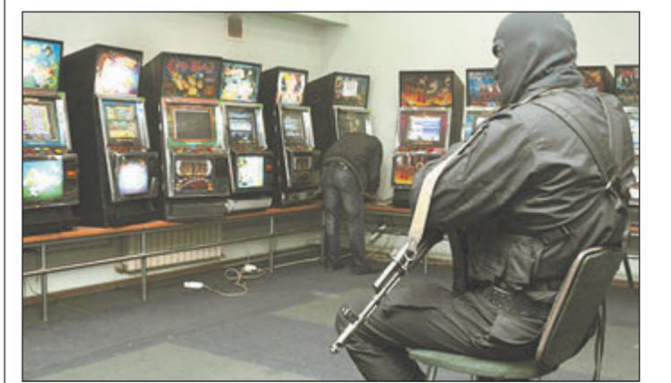
Штурмы подпольных казино в Подмосковье становятся традицией

подбирал клиентуру. Он накопился с игроками и, если чувствовал, что они платежеспособные, приводил их в казино. Потом клиента, прошедшего проверку, пропускали следующим образом: сообщали секретный номер мобильного телефона, и тот, подходя к заведению, этот номер набирал. Ему открывали дверь и заводили внутрь. В ходе осмотра места происшествия были обнаружены и изъяты около 20 игровых аппаратов различных модификаций, деньги, предназначенные для выплаты выигрышей посетителям. В настоящее время решается вопрос о возбуждении уголовного дела по статье «Незаконная организация и проведение азартных игр». Организаторам нелегального бизнеса может грозить лишение свободы на срок до трех лет. Только летом этого года в Подмосковье была пресечена деятельность шести незаконных игровых заведений. В Ногинске, Электроуглях, Старой Кулане и Черноголовке были закрыты подобные клубы. Доход только от одной точки составлял более шести миллионов рублей за 2-3 месяца.