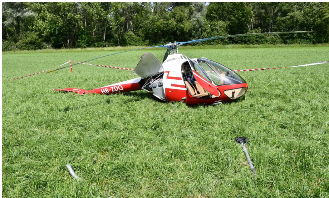
Figure 3 : Position finale de l'hélicoptère sur le site de l'accident

L'épave du HB-ZDQ a été transportée dans le hangar du SESE de façon à l'examiner de manière plus approfondie.